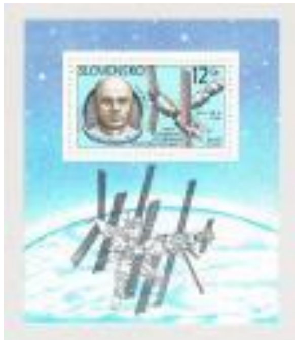
(スロバキア、1999年発行)