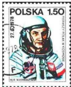
(ポーランド、1978年発行)