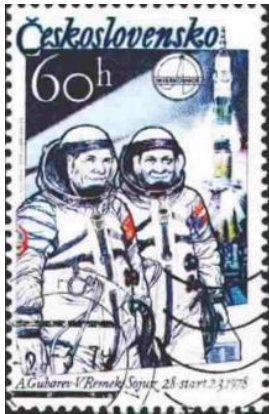
(チェコスロバキア、1978年発行)