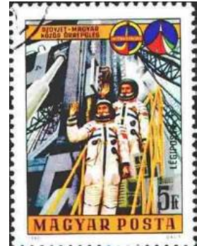
(ハンガリー、1980年発行)