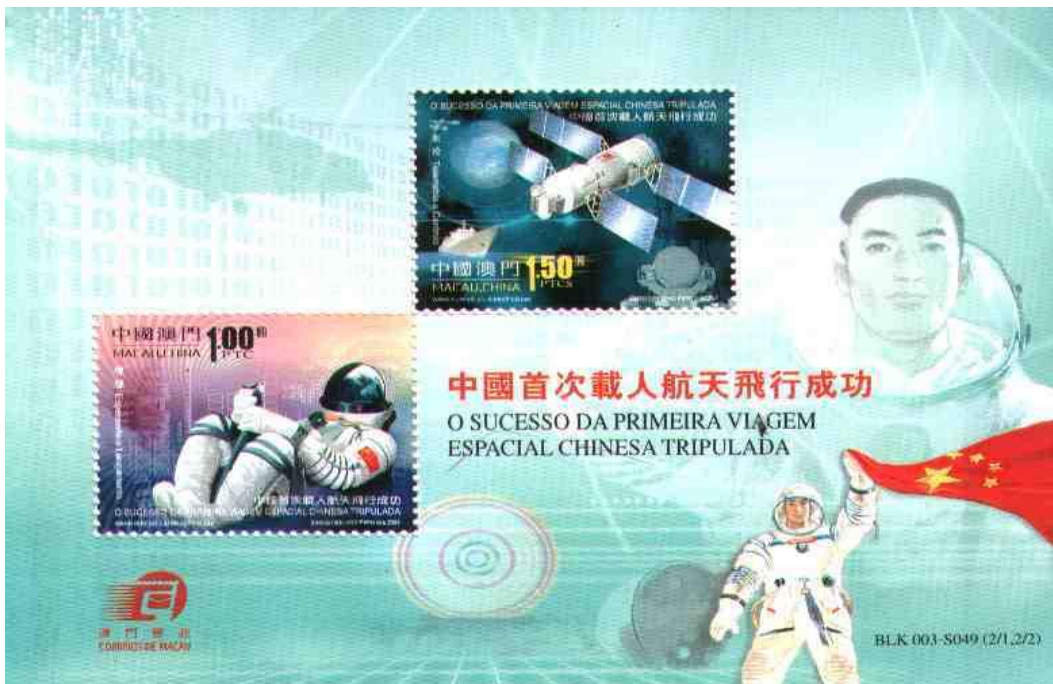
楊利偉 神舟5号 2003年10月15日打上げ